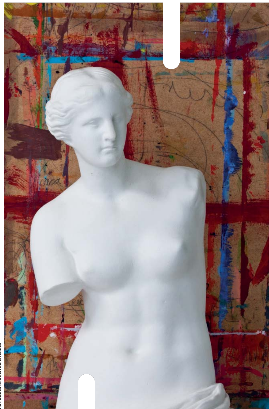
FOTOGRAFÍA DE ATXU AYERRA.